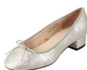
cloverleaf CL-1002 ¥3,490(税抜き)