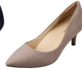
ChiffonFit CF-1001 ¥3,890(税抜き) CF-1002 ¥3,890(税抜き)