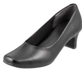
fuwaraku FR-1101 ¥3,890(税抜き)