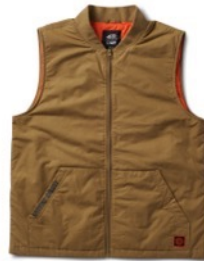
SPITFIRE WHEELS VEST (GOTHIC OLIVE)