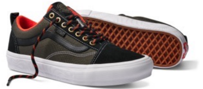
SKATE OLD SKOOL (SPITFIRE BLACK/FLAME)