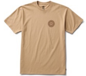
SPITFIRE WHEELS SS (INCENSE)