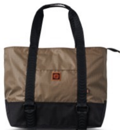
SPITFIRE WHEELS TOTE (CANTEEN)