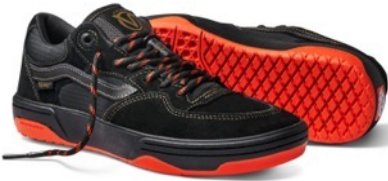
ROWAN 2 (SPITFIRE BLACK/FLAME)