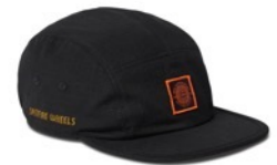
SPITFIRE WHEELS CAMPER (BLACK)