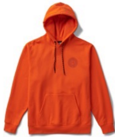
SPITFIRE WHEELS PO (FLAME)