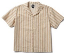
SPITFIRE WHEELS SS WOVEN (TURTLEDOVE)