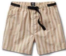
SPITFIRE WHEELS SHORT (TURTLEDOVE)