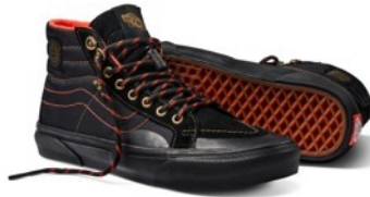
SKATE SK8-HI REISSUE (SPITFIRE BLACK/FLAME)