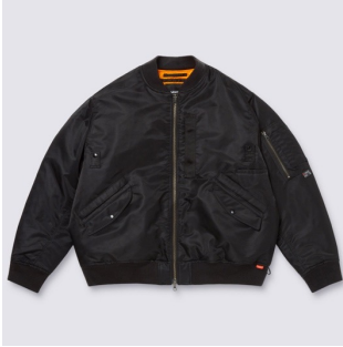
MTE MA-1 JACKET (BLACK)