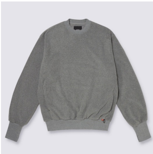
PULLOVER CREW (BLACK)