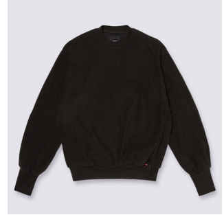
PULLOVER CREW (BLACK)