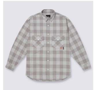
PLAID SHIRT (TONAL GREY PLAID)