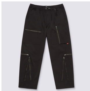
POCKETS PANTS (BLACK)