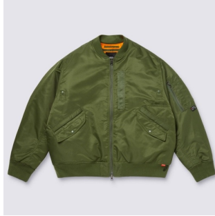
MTE MA-1 JACKET (BRONZE GREEN)