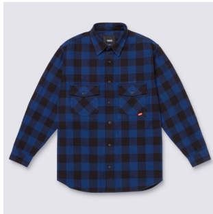
PLAID SHIRT (BLACK BLUE PLAID)