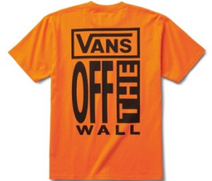
AVE SS TEE (FLAME)