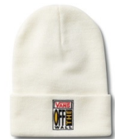
AVE TALL CUFF BEANIE (WHITE)