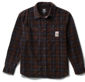
AVE LS WOVEN (DEMITASSE)