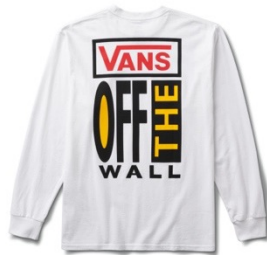
VN MN LS T-Shirts (WHITE)