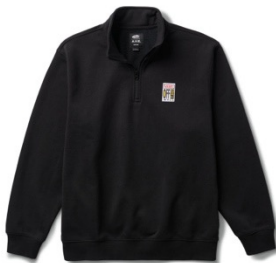
AVE Q-ZIP (Black)