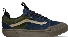
OLD SKOOL MTE-2 (UTILITY GUM NAVY/KHAKI) 品番：VN0009QEY2U 販売価格：¥14,850 (税込)