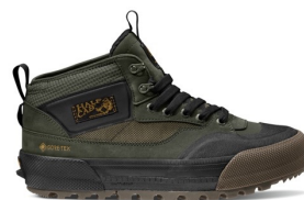
HALF CAB GORE-TEX MTE-3 (GRAPE LEAF/BLACK) 品番：VN0009QWKEK 販売価格：¥20,350 (税込)