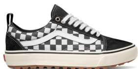
OLD SKOOL MTE-1 (BLK/WHITE/CHECKERBOARD) 品番：VN0A5I12A04 販売価格：¥12,100 (税込)