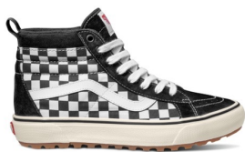
SK8-Hi MTE-1 (BLK/WHITE/CHECKERBOARD) 品番：VN0A5HZYA04 販売価格：¥13,200 (税込)