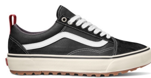
OLD SKOOL MTE-1 (BLACK/WHITE) 品番：VN0A5I12Y28 販売価格：¥12,100 (税込)