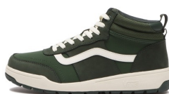
TYSON HI (GREEN/DK.GREEN) 品番：V8615 販売価格：¥10,450 (税込)