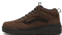
TWEAK WP (D.BROWN/BLACK) 品番：V2558 販売価格：¥16,500 (税込)