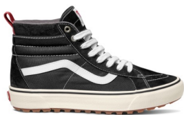
SK8-Hi MTE-1 (BLACK/TRUE WHITE) 品番：VN0A5HZY6BT 自店販売価格：¥13,200 (税込)