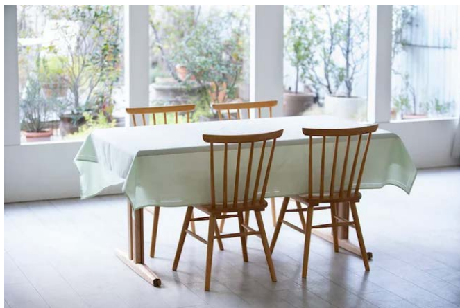
料理場面の撮影だけでなく、食事風景、食器、食材等の撮影も行うことができます。