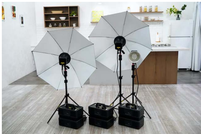
レンタルストロボ3台3灯無料