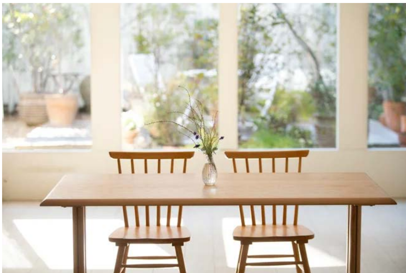
ガーデンテラス青背景に

坂ノ上スタジオは神楽坂駅から徒歩2分の好立地。特にガーデンテラス付きのCスタジオは、自然光と緑に囲まれた撮影環境が魅力です。いつもとは違った映像や写真を撮影してみませんか?