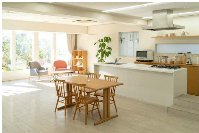
Cスタジオとガーデンテラスを内部から