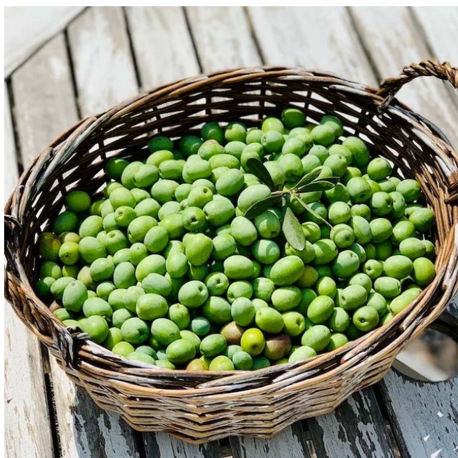
ガーデンで採れたオリーブ