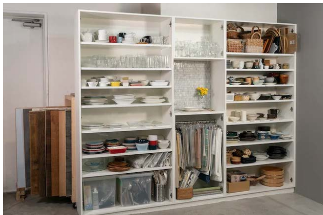
レンタル食器（無料）