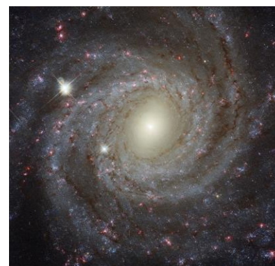
渦巻銀河 NGC 3344