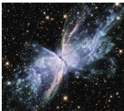
「バタフライ星雲」とも呼ばれるNGC 6302