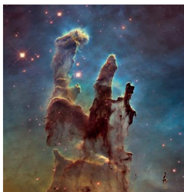
M16(わし星雲)内にある 「創造の柱」と呼ばれる領域