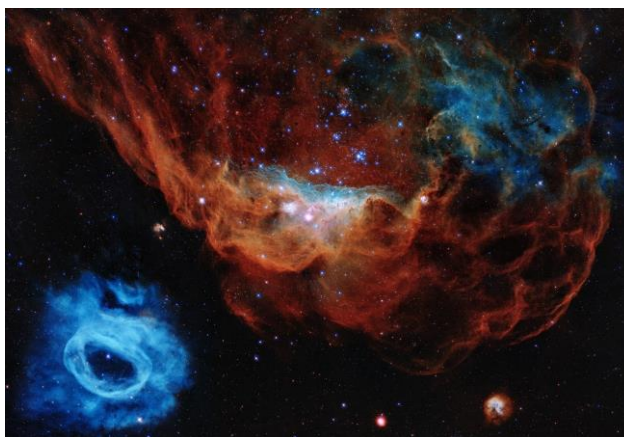
大マゼラン銀河の星形成領域 NGC 2014とNGC 2020 ハッブル宇宙望遠鏡打ち上げ30周年記念画像 Credit: NASA, ESA, and STScI