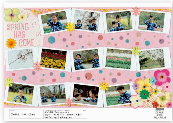
タイトル Spring Has Come 出展者のメッセージ 桜が満開だった春の一日。お花がたくさん咲いていて、子供たちも大喜び！いつまでもこのままで兄弟仲良くね。