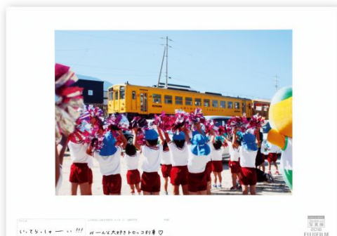
タイトル いってらっしゃーい!!! 出展者のメッセージ みーんな大好きトロッコ列車♡

昨年、鉄道をテーマとした作品を集め、「鉄道博物館(大宮)」「リニア・鉄道館(名古屋)」「京都鉄道博物館(京都)」で展示し、ご好評をいただきました。本年はより多くのお客さまに鉄道写真を楽しんでいただけるよう、3大鉄道博物館(入館料：有料)に加え、メイン7会場でも展示いたします。また、本年も鉄道写真家の中井精也さんが応募作品の中から20作品をセレクトし、会場で発表します。