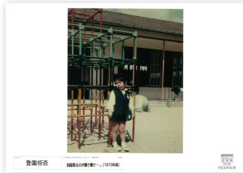
タイトル 登校拒否 撮影年代 ：昭和48年頃 出展者のメッセージ 制服着るのが嫌で嫌で…。