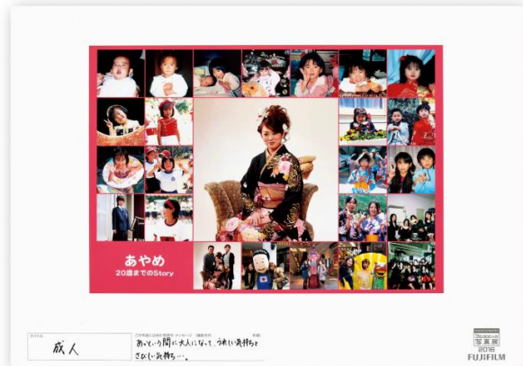
タイトル 成人 出展者のメッセージ あっという間に大人になって、うれしい気持ちとさびしい気持ち…。