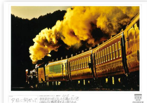
タイトル 夕日に向かって 出展者のメッセージ 秋も深まり低くなった太陽にオレンジ色に染め上げた機関車が走り抜けました