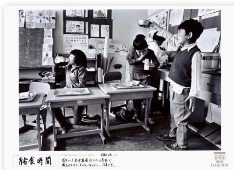
タイトル 給食時間 撮影年代 ：昭和48年頃 出展者のメッセージ 岩手の小岩井農場近くの小学校で撮らせてもらいました。なつかしい写真です。

ふるさとの風景や昔熱中していたものなど、出展者が懐かしいと思う写真を募集し、年月を経ても変わらない写真価値を伝えていきます。