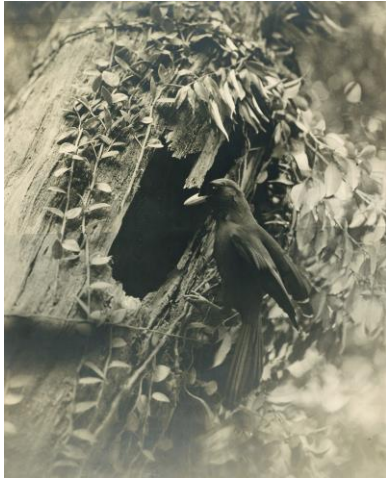
《巣穴に飛び込むルリカケス》1935年4月 鹿児島県奄美大島