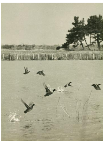
《コガモ》撮影年不詳 千葉県新浜