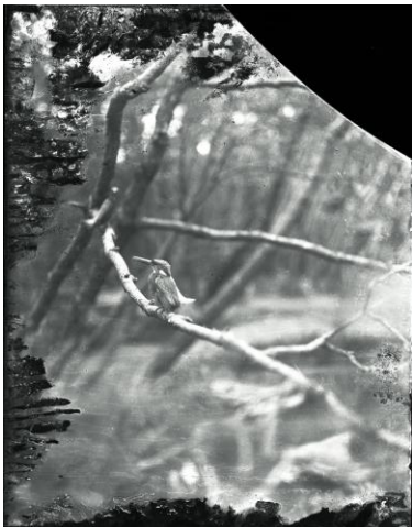
《カワセミ》1922年1月5日 佐賀県佐賀市 撮影:下村兼史 所蔵:(公財)山階鳥類研究所 ※展示作品は複製