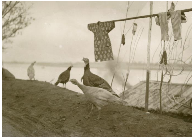
《河畔の暮》1920年代初期 撮影地不詳 撮影:下村兼史 所蔵:(公財)山階鳥類研究所 ※展示作品は複製