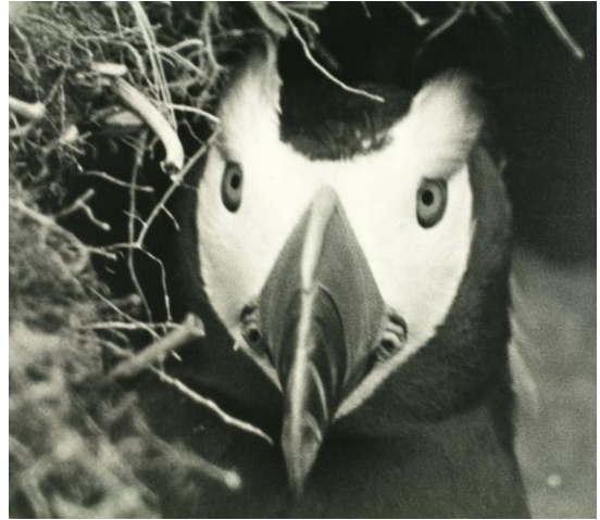
《エトピリカの顔》1934/1935年 北千島/パラムシル島