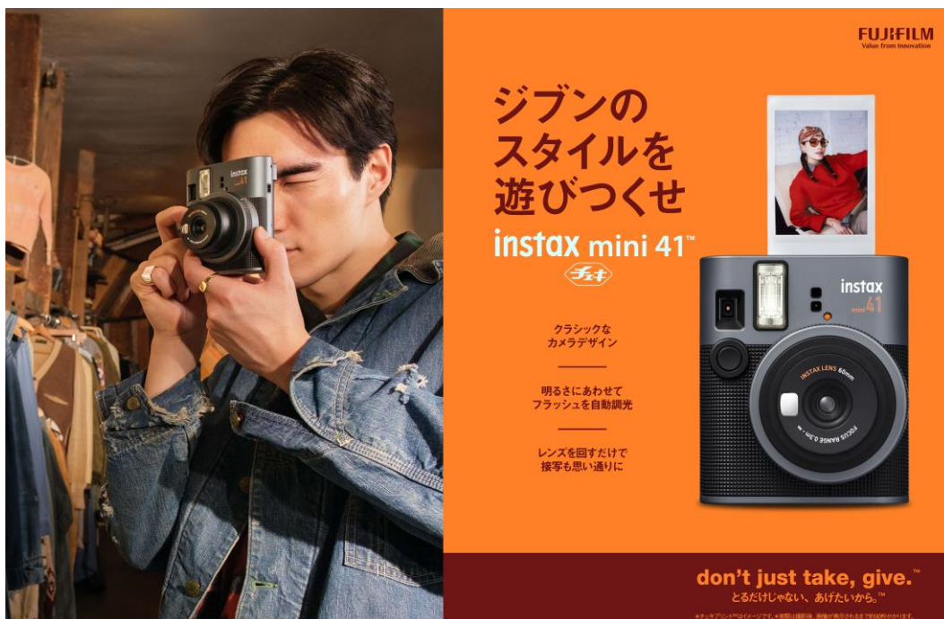
「mini 41」のキービジュアル

当社は今後も、“撮ったその場で、すぐにプリントが楽しめる”インスタントフォトシステム instax™の世界を広げていきます。