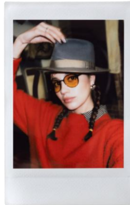
光量の少ない場所で撮影した写真