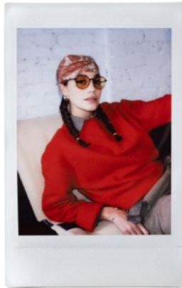
明るい場所で撮影した写真

シーンに合わせて最適なシャッタースピードやフラッシュ光量を自動調整。晴れた屋外や光量の少ない屋内、接写やセルフイーなどでも被写体を簡単・きれいに撮影できます。