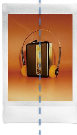
ファインダーから見たイメージ通りに 中心をずらさず撮影！