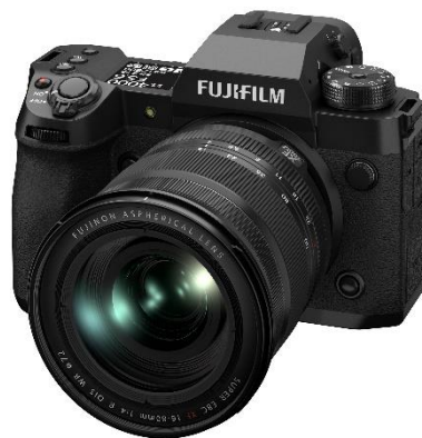
「XF16-80mmF4 R OIS WR」装着時

「X-H2」は、約4020万画素のAPS-Cサイズセンサーを新たに採用し、圧倒的な解像力を生かした静止画・動画撮影が可能なミラーレスデジタルカメラです。最速1/180000秒のシャッタースピードやISO125の常用感度を実現しているため、写真の撮影領域を拡大します。また、4倍の解像力と忠実な色再現による撮影が可能な「ピクセルシフトマルチショット」と肌のレタッチを自動で行う「スムーズスキンエフェクト」を「Xシリーズ」として初めて搭載。約1.6億画素の画像や滑らかな肌の画像を生成することが可能です。AIによる高精度なオートホワイトバランスも実現し、ハイクオリティな写真の撮影をお楽しみいただけます。