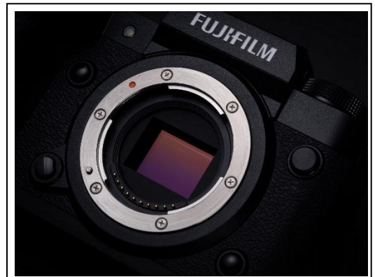
新開発の裏面照射型約4020万画素「X-Trans™ CMOS 5 HR」センサー。