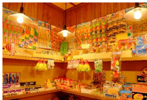
タイトル レトロな駄菓子屋発見！ 出展者のメッセージ 小学生には買えなかった、大好きな駄菓子の箱買いをしました。