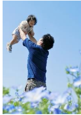
タイトル ママの目に映る幸せ 出展者のメッセージ 春に家族でネモフィラを観に行った時の1枚です。 綺麗なネモフィラと雲一つない青空、そして愛する家族の姿。この一瞬を忘れたくない！と撮りました。