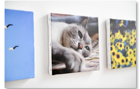
WALL DECOR (172mm×172mm)