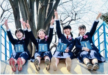
タイトル 未来に翔け 出展者のメッセージ 卒業おめでとう。 仲よし四人組