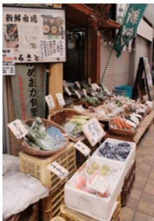
タイトル 新鮮市場 出展者のメッセージ おいしそうやわ～

「懐かしい。が新しい」をコンセプトに、昭和の時代を写した作品やノスタルジックな雰囲気の写真を募集します。