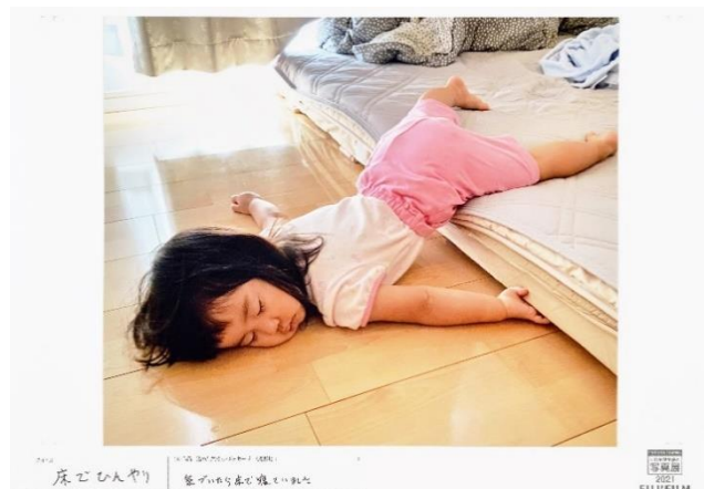
2021年出展作品 タイトル 床でひんやり 出展者のメッセージ 気づいたら床で寝ていました。

富士フイルムは、出展者全員の作品を、“写真に込められた想い”とともに展示する参加型写真展 ※3 を2006年にスタートしました。新型コロナウイルス感染拡大の影響で2年ぶりの開催となった「“PHOTO IS”想いをつなぐ。あなたが主役の写真展 2021」では、来場者より「実際の会場で鑑賞する感動は言葉にならない」「久しぶりに大伸ばしの写真プリントを見た。懐かしくもあり、新鮮だった」などの声が寄せられ、写真には、喜びや感動の大切な瞬間を思い出としてカタチに残し、その想いを共有することでたくさんの人を笑顔や元気にするチカラがあることを多くの方に改めて実感いただきました。