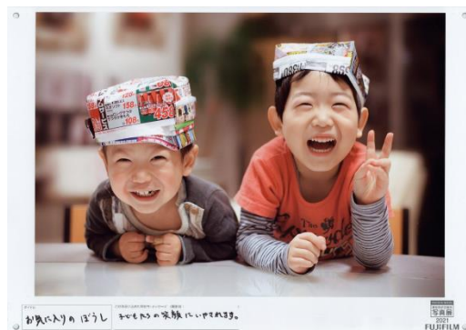
作品に寄せられた絆メッセージ（イメージ）

東京会場・大阪会場では、写真を“カタチ”にすることで、写真に囲まれた楽しい毎日を送ることを提案するコーナーを設けます。富士フィルムの新プロモーション「プリントデイズ by FUJICOLOR」※4と連動し、一部の応募作品を WALL DÉCOR(ウォールデコ) ※5 やマグカップなどにして展示する予定です。