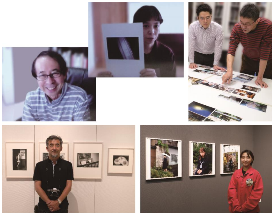
2019年レビュー開催後の個別アドバイス(オンライン・対面式)、2020年写真展開催時の様子