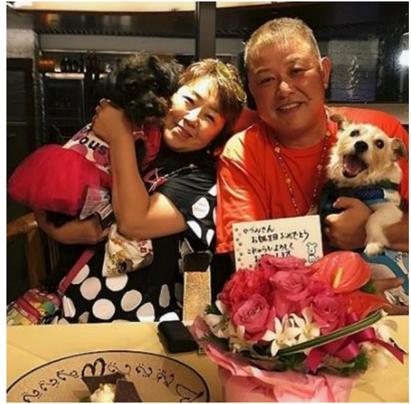
タイトル：家族旅行で誕生日のお祝い この写真にこめた想い：ワンコが子供の我が家。 毎年お母さん（私）の誕生日はお父さんの夏休 みなので旅先でお祝いしてもらってます。