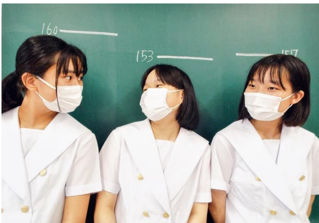
タイトル: 背比べ この写真にこめた想い: 高校生の放課後