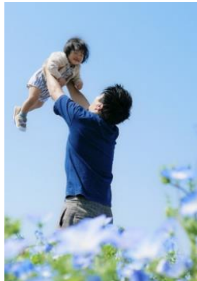
タイトル: ママの目に映る幸せ この写真にこめた想い: 春に家族でネモフィラを観に行った時の1枚です。綺麗なネモフィラと雲一つない青空、そして愛する家族の姿。この一瞬を忘れたくない!と撮りました。