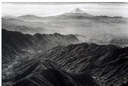
「山波」撮影：岡田紅陽 収蔵：岡田紅陽写真美術館

【展示会場】札幌会場、仙台会場、名古屋会場、大阪会場、広島会場、福岡会場の6会場