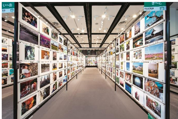
2019年に開催された際の会場の様子

富士フイルム株式会社(本社:東京都港区、代表取締役社長・CEO:後藤禎一)は、写真を撮る喜び、プリントして飾る楽しさを多くの方に感じていただくため、参加型写真展「PHOTO IS」想いをつなぐ。あなたが主役の写真展 2021」を10月8日から12月12日の期間に、全国10会場 *1 で順次開催します。まずは、10月8日より富士フイルム東京本社の「フジフイルム スクエア」および東京ミッドタウンの東京会場にてスタートいたします。なお、会場での展示は、新型コロナウイルス感染拡大の防止策を十分に講じたうえで実施いたします。また会場にご来場いただけない方にも本写真展をお楽しみいただけるよう、全ての出展作品 *2 を11月19日よりオンラインでも公開いたします *3 。