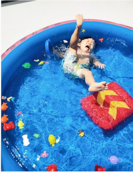
タイトル：はじめてのおうちプール この写真にこめた想い：夏の思い出