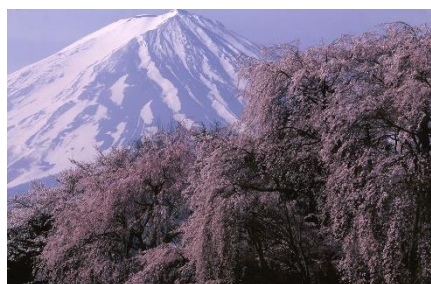
山梨県勝山村（現富士河口 湖町）から「桜と富士」