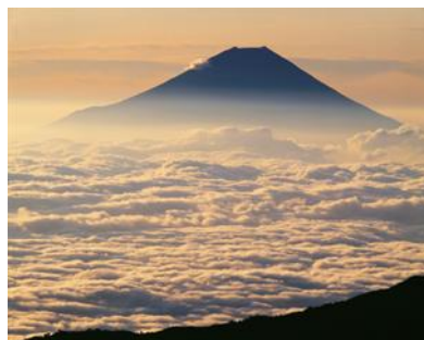
南アルプス千枚岳 から「雲海と富士」