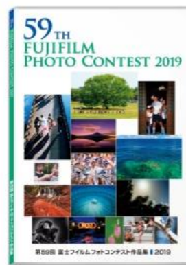
第 59 回富士フィルムフォトコンテスト作品集