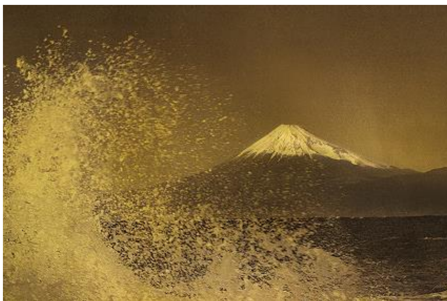
Homage to Hokusai ©Mineko Orisaku