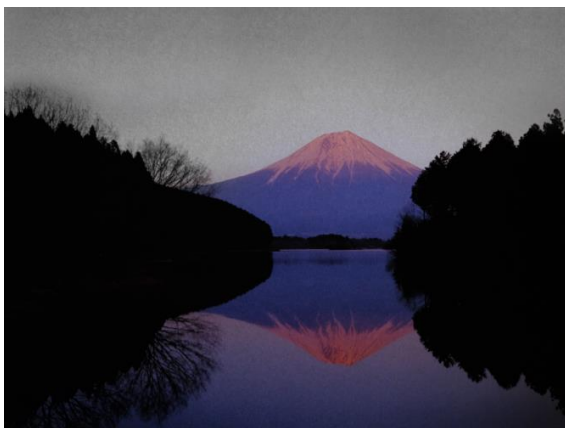
Following sunset (Tanuki-ko Lake)