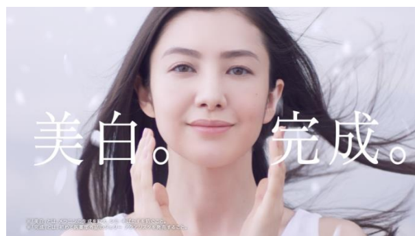
アスタリフト「花びら」篇