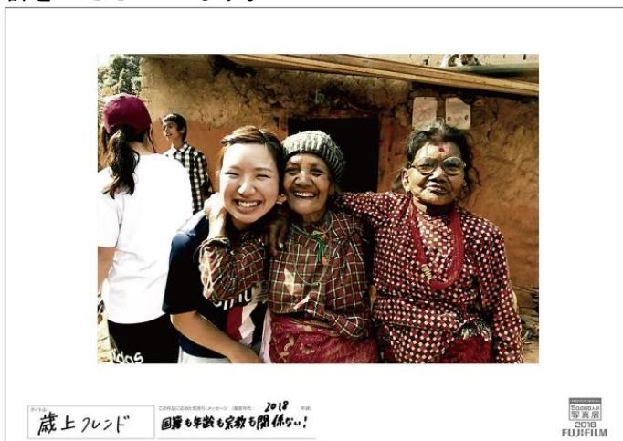
タイトル 歳上フレンド

さらに、今年も昨年に引き続き、本写真展の趣旨に賛同いただいた複数企業・団体との共同企画展を併催します。ご両親からお子さまへの愛情が伝わる写真やペットの愛らしい姿、食卓を囲む家族の笑顔など、素晴らしい写真がたくさん寄せられています。毎年この共同企画を通して初めて写真展に参加される方も多く、「写真を会場で見ると、スマホの画面とは違う大サイズプリントの迫力を感じられる」「一緒に会場に行く家族の笑顔や感想が楽しみ」など大変好評をいただいています。