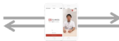
オンライン診療アプリ 「CLINICS」