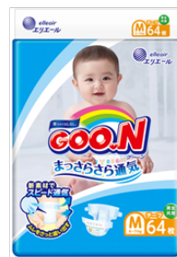
GOO.N まっさらさら通気 Mサイズ