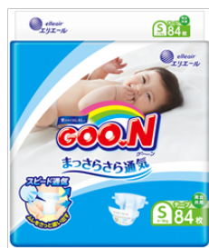
GOO.N まっさらさら通気 Sサイズ