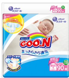
GOO.N まっさらさら通気 新生児用