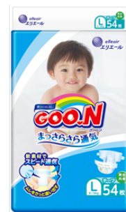
GOO.N まっさらさら通気 Lサイズ