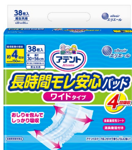
アテント 長時間モレ安心パッドワイドタイプ 4回吸収 38枚

大王製紙株式会社（住所：東京都千代田区）は、従来の「アテント 長時間 1枚安心パッドおしりを包む大判サイズ 4回吸収」を、テープ式に併用するパッドを初めて使う生活者に向けて、「アテント 長時間モレ安心パッドワイドタイプ 4回吸収」としてリニューアルし2019年4月21日（日）より全国で発売します。