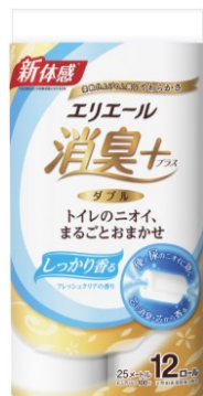
12 R (ダブル)

エリエール消臭+ (プラス) トイレットティッシュ しっかり香るフレッシュクリアの香り