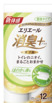
12 R (ダブル)

エリエール消臭+ (プラス) トイレットティッシュ ほのかに香るナチュラルクリアの香り