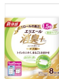
コンパクト8 R (ダブル)