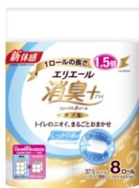
コンパクト8 R (ダブル)