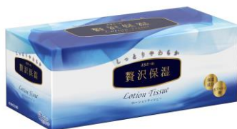
〈贅沢保湿 200 組〉