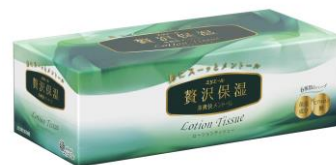
〈贅沢保湿 鼻爽快メントール 160 組〉