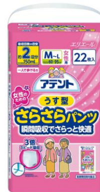
アテントうす型さらさらパンツ女性用 瞬間吸収でさらっと快適