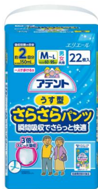
アテントうす型さらさらパンツ男女共用 瞬間吸収でさらっと快適

エリエールブランドの大王製紙株式会社(住所:東京都中央区八重洲 2-7-2)は、大人用排泄ケア用品ブランド「アテント」から、モレに安心のスピード吸収で表面がさらっと快適な『アテントうす型さらさらパンツ』—瞬間吸収でさらっと快適—を発売いたします。