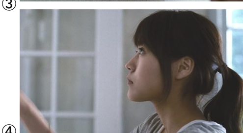
【有村さん】 弱い私は、