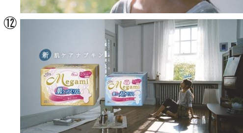
新・肌ケアナプキン