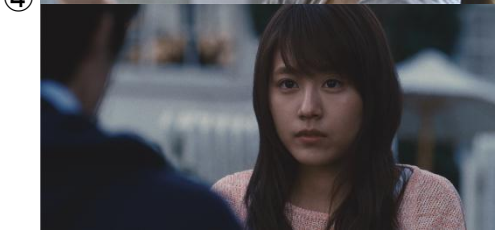
【有村さん】 もうやめた。