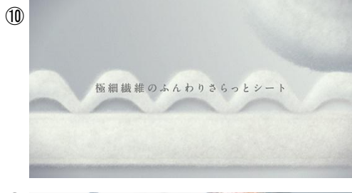
極細繊維のふん わりさりとシート