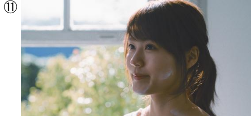
【有村さん】 負けるな、わたし。