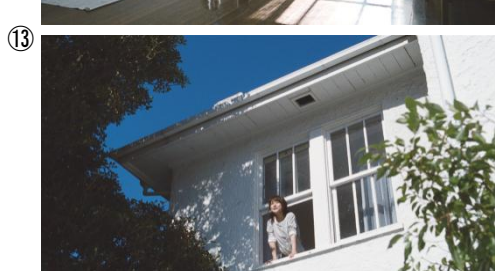
【Na】 「新 メガミ誕生」