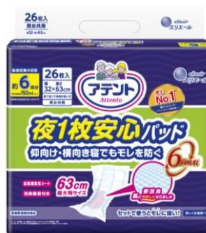
アテント 夜 1 枚安心パッド 仰向け・横向き寝でもモレを防ぐ 6 回吸収 26 枚