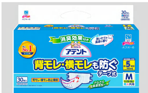
アテント テープ式背モレ・横モレも防ぐ(業務用)