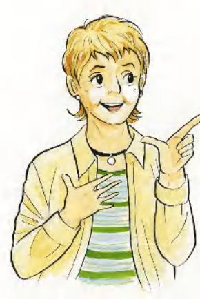
快滴さらり 安心パッド