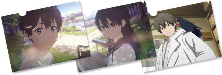
初級編 特典：クリアファイル3種(イメージ)

キット購入時に、もれなく1つプレゼント！ 初級編／クリアファイル3種類の中からランダムで1種類 上級編／ボールペン2種類からランダムで1種類