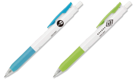
上級編 特典：ボールペン(イメージ)