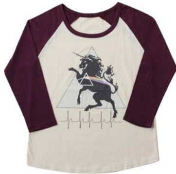
大阪会場 ラグランTEE

心齋橋OPA、京阪モール、HEP FIVE、南堀江、天王寺ミオ、なんばマルイ、EC SHOP