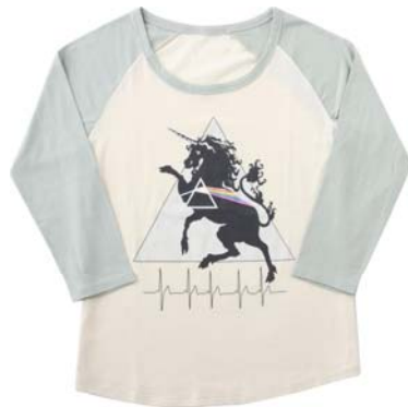
福岡会場 ラグランTEE