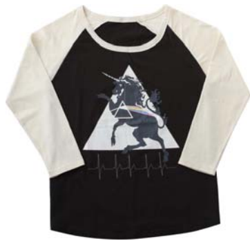
仙台会場 ラグランTEE