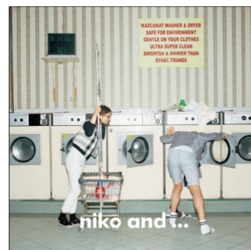
niko and ... ニコアンド ターゲット：25～35 歳の男女 国内店舗数：119 店舗 （15 年 6 月末）

その他スタディオクリップ、レプシムローリーズファームなど全 22 ブランドを展開しています。