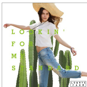
LOWRYS FARM ローリーズファーム ターゲット：20～30 代の女性 国内店舗数：141 店舗 （15 年 6 月末）