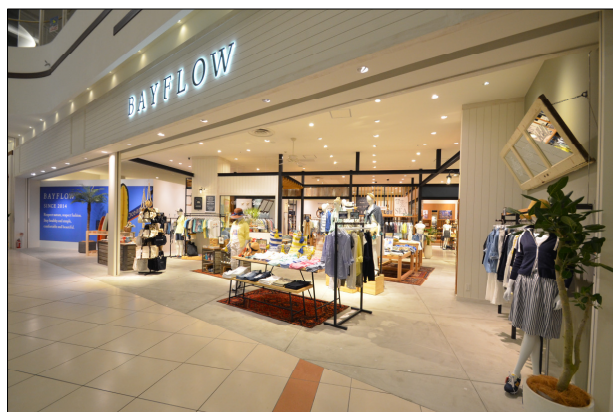
<ベイフローイオンレイクタウン店の店舗写真>

ファッションを愛する大人の男女に向けた“上質なデイリーカジュアルウェア&生活雑貨”を提案するベイフロー。昨年のブランドデビューを果し、現在全国で22店舗（WEBストア含む）を展開しています。この度、今春オープンしたベイフローイオンレイクタウン店の隣に、コーヒービーン&ティーリーフの日本5号店が7月31日（金）にオープンすることが決定しました。