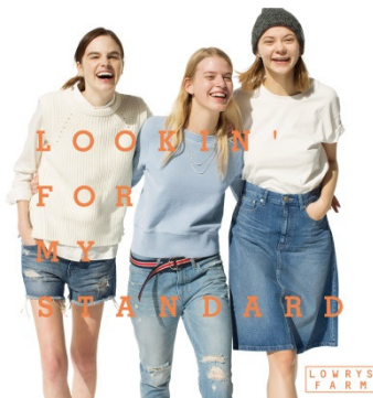
LOWRYS FARM ローリーズファーム ターゲット：20～30 代の女性 国内店舗数：140 店舗 （15 年 2 月末）