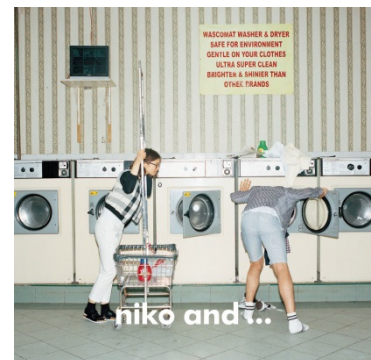
niko and ... ニコアンド ターゲット：25～35 歳の男女 国内店舗数：116 店舗 （15 年 2 月末）

その他スタジオクリップ、レプシムローリーズファームなど全 22 ブランドを展開しています。