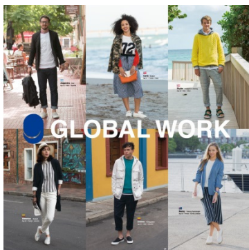
GLOBAL WORK グローバルワーク ターゲット：20～30 代の男女とキッズ 国内店舗数：178 店舗 （15 年 2 月末）