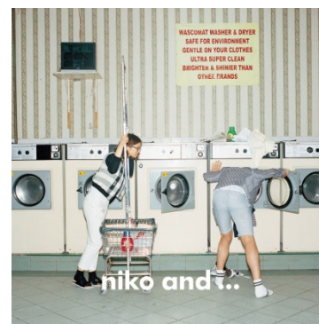
niko and... ニコアンド ターゲット：25～35 歳の男女 国内店舗数：116 店舗 （15 年 2 月末）

その他スタジオクリップ、レプシムローリーズファームなど全 22 ブランドを展開しています。