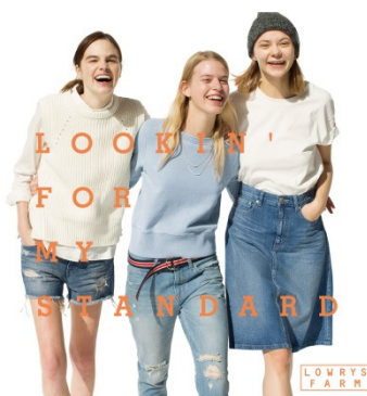
LOWRYS FARM ローリーズファーム ターゲット：20～30 代の女性 国内店舗数：140 店舗 （15 年 2 月末）