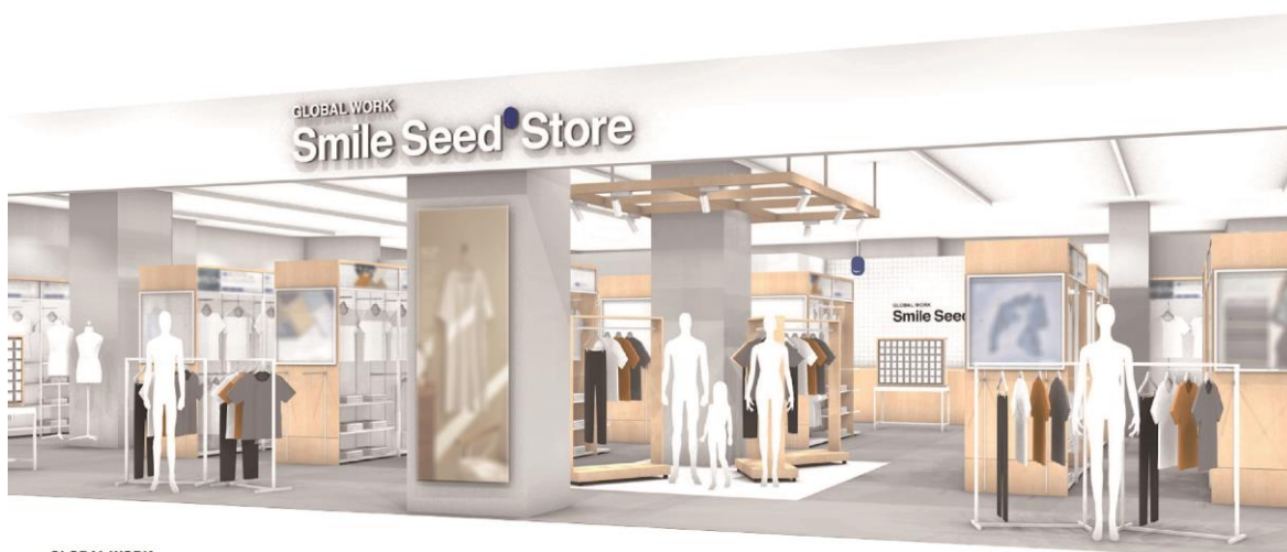
GLOBAL WORK Smile Seed Store

「Play fashion!」をミッションに掲げ、「グッドコミュニティ共創カンパニー」を目指す株式会社アダストリア（本部：東京都渋谷区渋谷 2-21-1、代表取締役社長：木村 治）が展開するGLOBAL WORK（グローバルワーク）は、新業態「Smile Seed Store (スマイルシードストア)」の出店を2023年春より開始いたします。「ベーシック」「デイリー」「エイジレス」をキーワードにした商品ラインアップと価格帯で、ブランドとして新しいマーケットでのポジション確立を目指します。