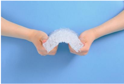
①復元性（体重を押し返す力）が高く睡眠時の寝返りがスムーズ