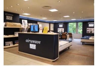
全国各地に次々と新店舗がOPEN!

快適な寝心地が評価され、トップアスリート、JAL国際線ビジネスクラスやファーストクラスをはじめ、石川県和倉温泉「加賀屋」全室等様々な採用実績があります。