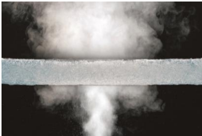
③通気性抜群で夏は蒸れにくく、冬は暖かい