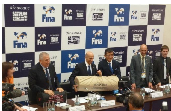
カザン(ロシア)での調印式にて(2015年8月3日)

エアウィーヴは、睡眠を通して世界の人々の健康に寄与することをミッションと考え、2015年からはアジア、アメリカなどへ本格的なグローバル展開を進めています。大会に出場する選手たちには、最高のコンディションで競技ができるよう、睡眠を通して強力にサポートしてまいります。