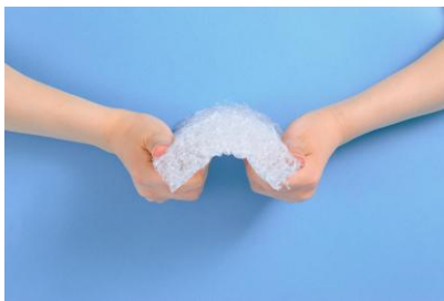
①復元性（体重を押し返す力）が高く睡眠時