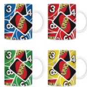
ウノマグカップ(8名)