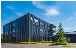
ウノホテル宿泊券(1組)