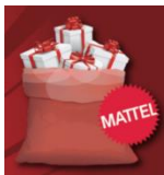
マテル・インターナショナル おもちゃ持ち帰り券(2名)