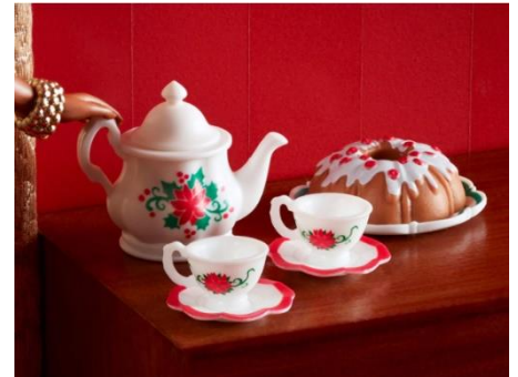
ポインセチアやプレゼント、ケーキの小物で クリスマスのパーティーを準備しよう！