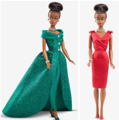
クリスマスを象徴とする緑や赤のドレスが 華やかさを演出