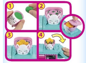
ラマの花びんにねんどを入れると お花があらわれる