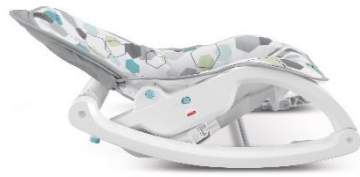
お誕生の頃はリクライニングで

「インファント・トドラーロッカー(ヘキサゴン)」は、お子さまの成長に合わせて 3WAY で長くお使いいただけるベビーラック&ロッキングチェアです。