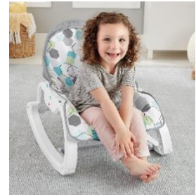
大きくなったらロッキングチェア