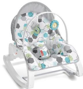
おすわりの頃からアップライトに