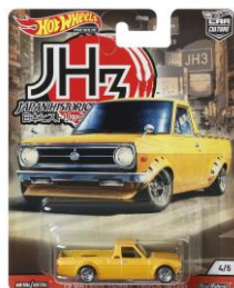
'75 ダットサン・サニー・トラック