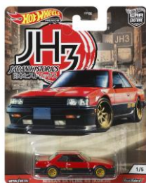
'85 ホンダ・シティ・ターボ