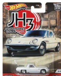
'68 マツダ・コスモ・スポーツ