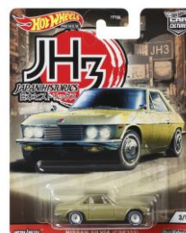
ニッサン・シルビア (CSP311)