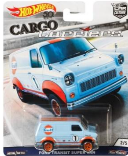
FORD TRANSIT SUPER VAN フォード・トランジット・ スーパー・バン