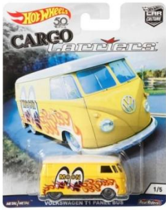
VOLKSWAGEN T1 PANEL BUS フォルクスワーゲン T1 パネル・バス