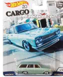
NISSAN C10 SKYLINE WAGON ニッサン C10 スカイライン・ワゴン