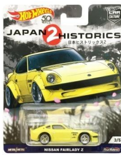
NISSAN FAIRLADY Z ニッサンフェアレディZ