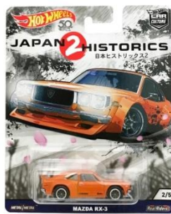
MAZDA RX-3 マツダ RX-3