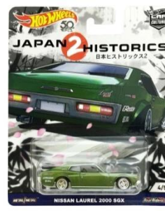
NISSAN LAUREL 2000 SGX ニッサン・ローレル 2000SGX