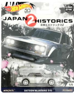
DATSUN BLUEBIRD 510 ダットサン・ブルーバード 510