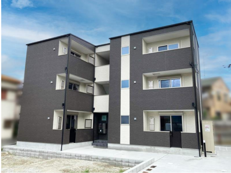
物件外観のイメージ画像