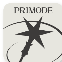
サービスロゴマーク