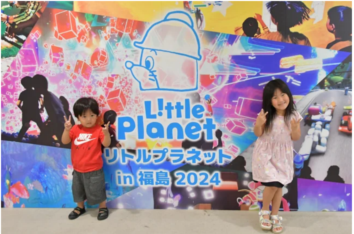
「車のレースがいちばん楽しかった！」と元気にインタビューに応じてくれました

福島日産のお客様で、郡山市からお越しいただいたご家族は「今の時期はとても暑いので、子どもたちが屋内で遊べる企画を紹介していただいて、さらに無料でご招待いただいてありがたかったです。（最新技術を活用した遊びは）子どもたちも夢中になってはしゃいで遊んでいました。」と述べていました。