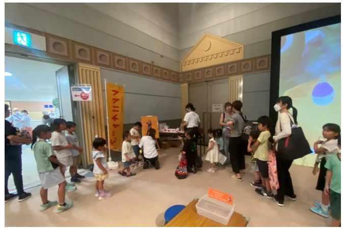
フクニチャージマンなりきりフォトスポットの様子

福島日産のお客様で、郡山市からお越しいただいたご家族は「今の時期はとても暑いので、子どもたちが屋内で遊べる企画を紹介していただいて、さらに無料でご招待いただいてありがたかったです。（最新技術を活用した遊びは）子どもたちも夢中になってはしゃいで遊んでいました。」と述べていました。