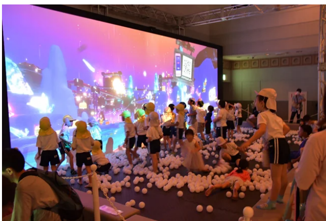
デジタル世界での当て遊び！冒険型シューティングギャラリー「ZABOOM JOURNEY Lite」

全3部入れ替え制で実施した福島日産プレオープンデーでは、訪れたお子様や保育園児などが思い思いにアトラクションを楽しむ姿が見られました。