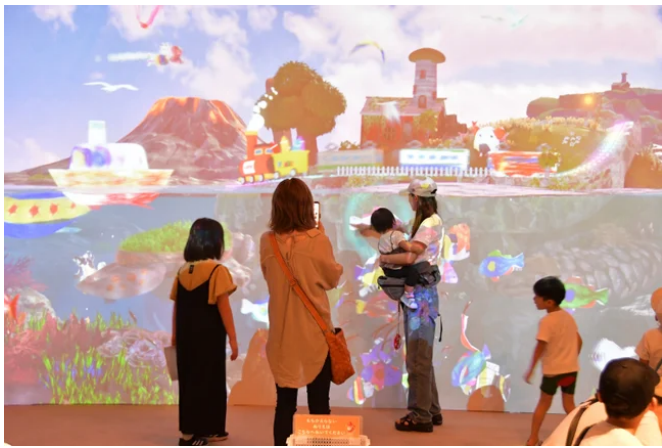
自分で描いた魚が泳いでる！