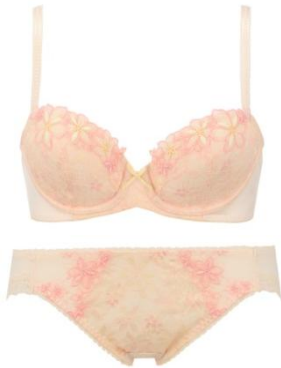
ブラジャー&ショーツセット