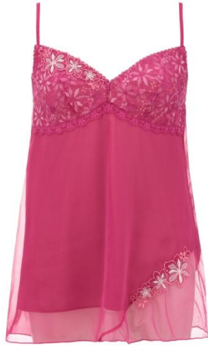
ロングキャミソール