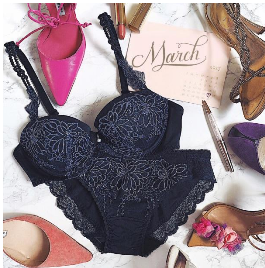
【夢みるブラ。Luxury シリーズ】

“一人ひとりの自信を高める会社” トリンプ・インターナショナル・ジャパン株式会社(本社:東京都中央区築地5-6-4、代表取締役社長:土居健人)の直営店「AMO'S STYLE by Triumph(アモスタイル バイ トリンプ)」では、『夢みるブラ®』の最新作を、2017年3月2日(木)より全国の「アモスタイル バイ トリンプ」にて順次発売します。