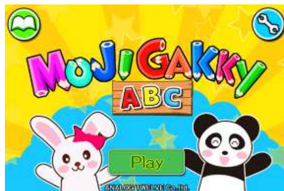
▲英語版のスタート画面

『もじガッキーABC』は、遊びながらアルファベットや英単語が学べる、幼児向けの知育アプリです。英単語を画面に書きながら回答するので、格段に高い学習効率を実現します。