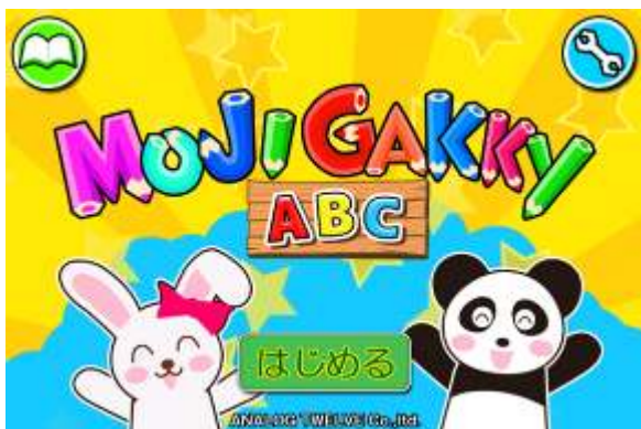
▲日本語版のスタート画面

株式会社 ANALOG TWELVE（アナログトゥエルヴ、本社：東京都千代田区、代表取締役社長 赤松隆 http://www.analog12.co.jp/ 以下 ANALOG TWELVE）は、スマートフォンやタブレットの画面に文字を書きながら楽しく学べる知育アプリ『もじガッキー』の新バージョンとして、遊びながらアルファベットや英単語を画面に書いて覚える『もじガッキーABC』を、本日8月15日（土）より Google Play および App Store にて提供開始いたします。本アプリでは、英語圏のユーザーも視野に入れ、日本語版と英語版のユーザーインターフェイスを用意しています。