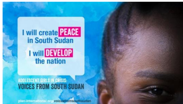
「南スーダンで平和になりたいです。そして、国を発展させたいです」南スーダンの女の子

今後もプランは、危機状況下の女の子の教育や必要な支援に対する国際社会の関心を高め、政府が危機状況下にある子どもたちに質の高い教育を保障するよう、働きかけを強化していきます。